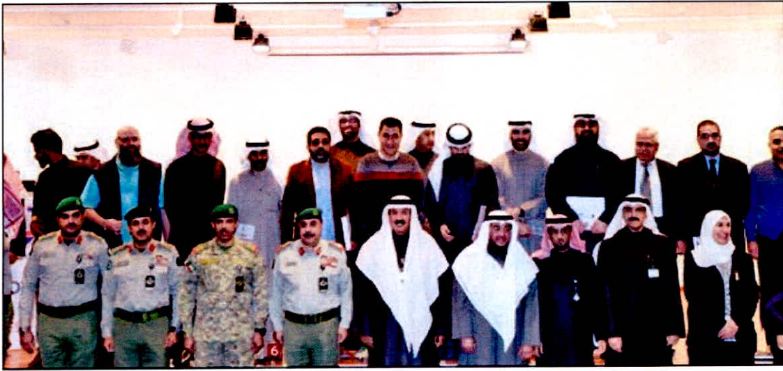
• الحضور في صورة جماعية